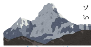
ちよう せん じよう